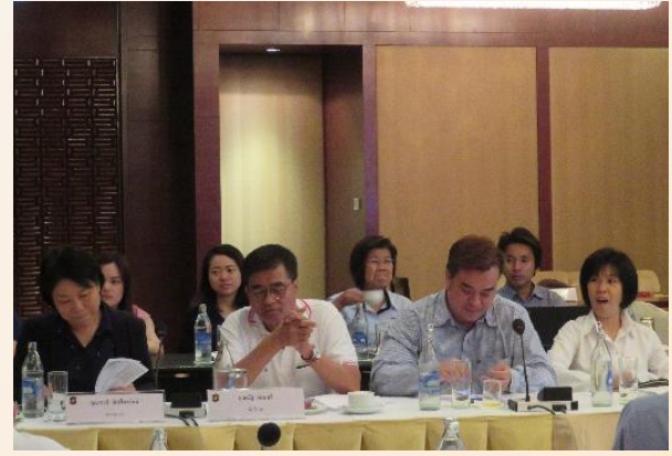
26 เมษายน 2562 TTIA จัดประชุมวิสามัญ ครั้งที่ 2/2562 และประชุมใหญ่สามัญประจำปี 2562 ณ ห้อง Garden Gallery โรงแรมแห่งกรี-ลา VDO ผลงานสมาคมอุตสาหกรรมทูน่าไทย(TTIA) ปี 2561 https://www.youtube.com/watch?v=UqXAEgmH1jw&feature=youtu.be อ่านต่อหน้า 8